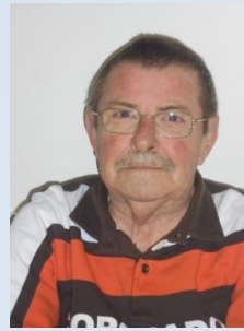
Curiosidades Humberto Lopes

No entanto, em catalão “Amansar” tem um significado totalmente diferente. Um catalão quando compra uma casa tem que se “Amansar” a essa casa. Ou seja, tem que se adaptar à casa, mobilá-la a seu gosto. Isto é, “Domesticar” a casa.